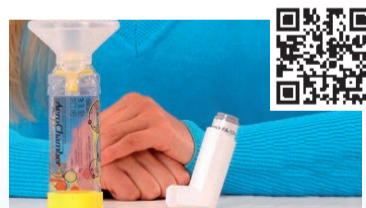
Aerochamber Plus Flow-VU® mit Maske (Kinder 1-5 Jahre)