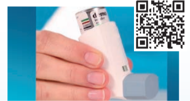
Dosieraerosol mit Zählwerk