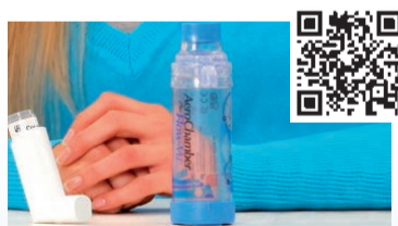
Aerochamber Plus Flow-VU® mit Mundstück (Erwachsene)