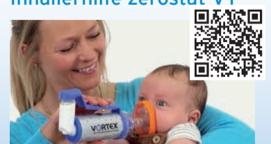
VORTEX® antistatische Inhalierhilfe für Babys von 0-1,5 Jahren