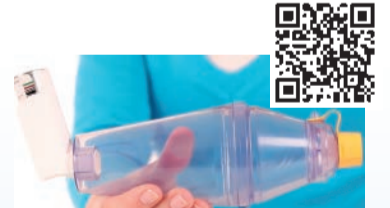
Inhalierhilfe zerostat VT