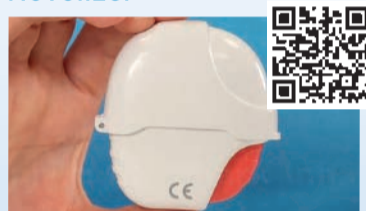
Tiotropium Glenmark Inhaler